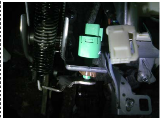
足元ストップランプスイッチ (ブレーキスイッチ部)