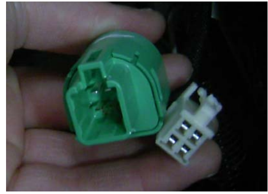
車輛ブレーキコネクタの形状