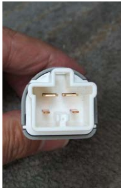
車輛ブレーキコネクタの形状