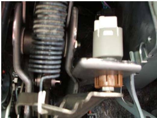
足元ストップランプスイッチ (ブレーキスイッチ部)